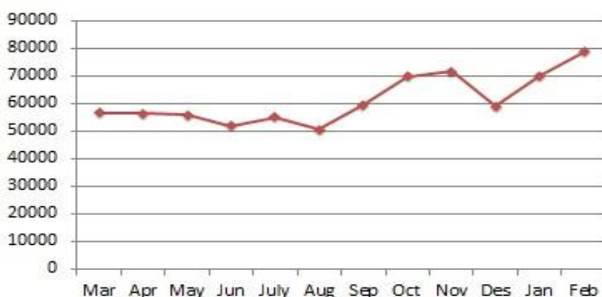
نمودار ۲-۳- میزان مشاهده و دانلود مقالات مجلات دانشگاه از طریق بانک اطلاعاتی PubMed در بازه زمانی مارس ۲۰۱۳ تا فوریه ۲۰۱۴ میلادی

بر اساس گزارش استفاده و دانلود PubMed Central، در سال ۱۳۹۲، در مجموع ۷۳۴۶۷۴ بار متن کامل مقالات این مجلات به یکی از صورت‌های html و یا PDF مشاهده و یا دانلود شده است. فقط در ماه نوامبر ۲۰۱۳ میلادی، ۷۱۷۴۰ بار این مقالات مشاهده و دانلود شده‌اند. آمار میزان مشاهده و دانلود مقالات این مجلات از طریق بانک اطلاعاتی PubMed به تفکیک ماه در بازه زمانی مارس ۲۰۱۳ تا فوریه ۲۰۱۴ میلادی در نمودار ۲-۳ آمده است.