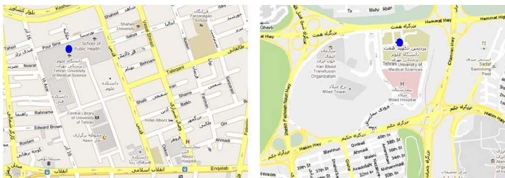
شکل ۱-۱- نقشه و نشانی پردیس های همت و پور سینا دانشگاه علوم پزشکی تهران

در این تعریف خدمات سلامت تنها خدمات مربوط به تشخیص و درمان بیماری ها نبوده و شامل خدماتی که باعث داشتن شیوه زندگی سالم و توانمندی مردم در تأمین سلامت خویش می شود، هم شده است. در شکل زیر موقعیت دو پردیس دانشگاه که هر دو در منطقه شش شهرداری واقع شده اند مشخص شده است.