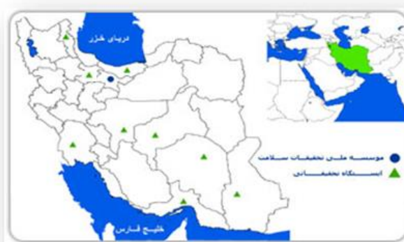
شکل ۲-۱- ایستگاه‌های تحقیقات سلامت وابسته به دانشکده بهداشت و مؤسسه ملی تحقیقات سلامت جمهوری اسلامی ایران بر روی نقشه [این نقشه از وب‌گاه مؤسسه ملی تحقیقات سلامت جمهوری اسلامی ایران برداشت شده است]