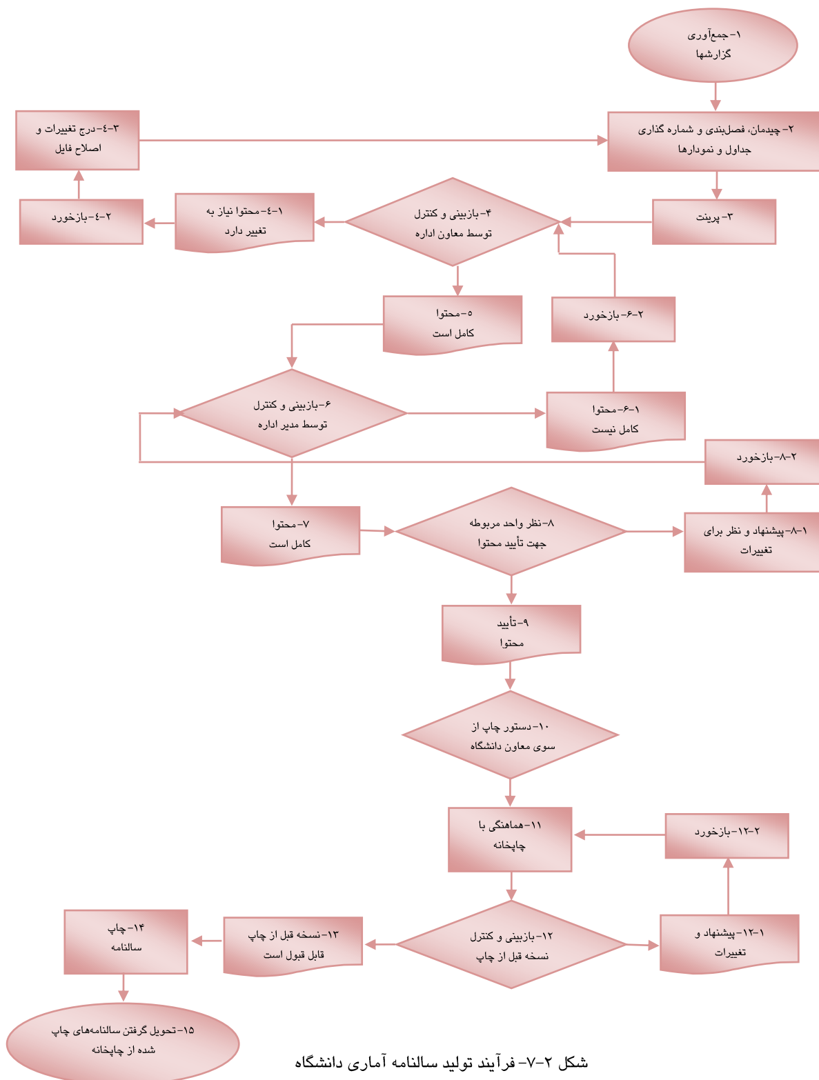
شکل ۲-۷- فرآیند تولید سالنامه آماری دانشگاه

مدیریت آمار و فناوری اطلاعات دانشگاه در راستای رسالت سازمانی خود اقدام به تهیه گزارش‌های مختلفی برای استفاده مدیران می‌نماید. یکی از این گزارش‌ها سالنامه آماری دانشگاه می‌باشد. در سال ۸۸ نیز سالنامه آماری دانشگاه تهیه و چاپ شده و اکنون به یاری خدا و تلاش همکاران دانشگاه، چهارمین سالنامه آماری دانشگاه که حاوی اطلاعات سال ۱۳۸۸ می‌باشد، چاپ و در اختیار مدیران محترم دانشگاه قرار گرفته است. فرآیند تولید سالنامه در مدیریت آمار و فناوری اطلاعات دانشگاه در شکل زیر ارائه شده است.