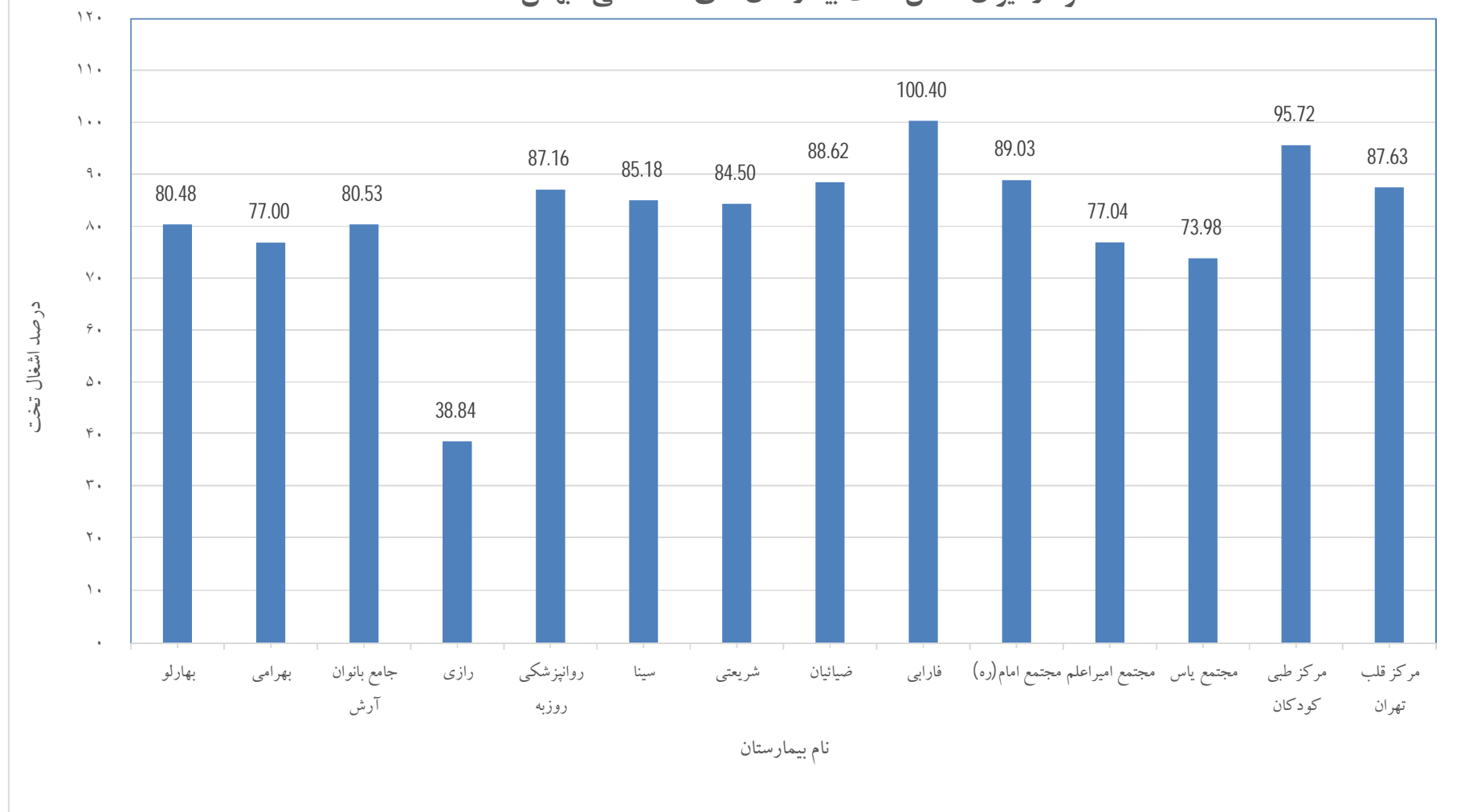
نمودار میزان اشغال تخت بیمارستان های دانشگاهی - بهمن 1398